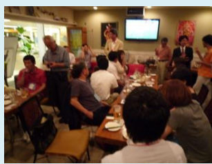
セミナー後の交流会で 異業種の方とどんどん ネットワークを広げましょう (交流会の様子)

皆様のひとりひとりの思いがモノづくりの原点です。 その思いを話してください。 1枚の名刺から始まるつながりです。 お気軽にご参加下さい