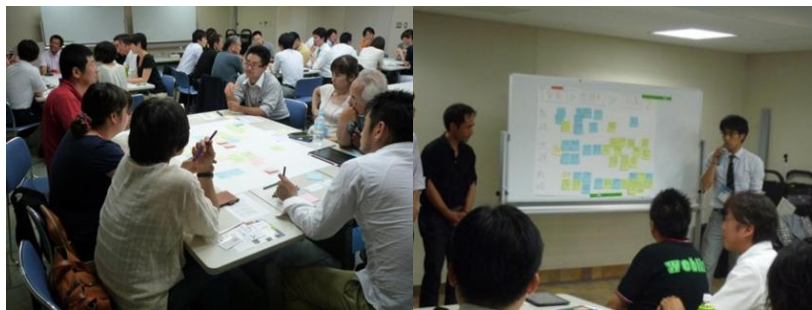
(上)岐阜で開催したセミナー(ワークショップ)の様子 グループ別発表の様子(右)

岐阜県はモノづくりの産業が大変活発です。その中でも飛驒地区は木工産業の歴史も古く、匠の技と称される伝統技術の宝庫です。飛驒を支えるモノづくりの発展と新たな結びつきを持ちたいと考えている方々の集う1日に是非ご参加ください。